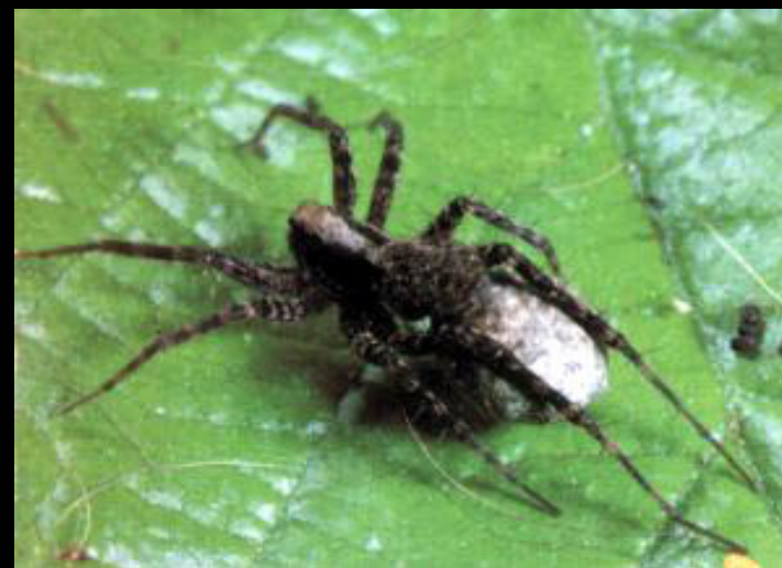
Pardosa sphagnicola gatunek borealno - górski